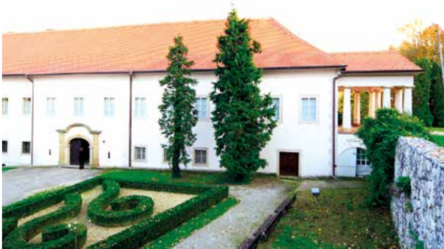
Sjeverno ulazno pročelje; zbirka Šćitaroci