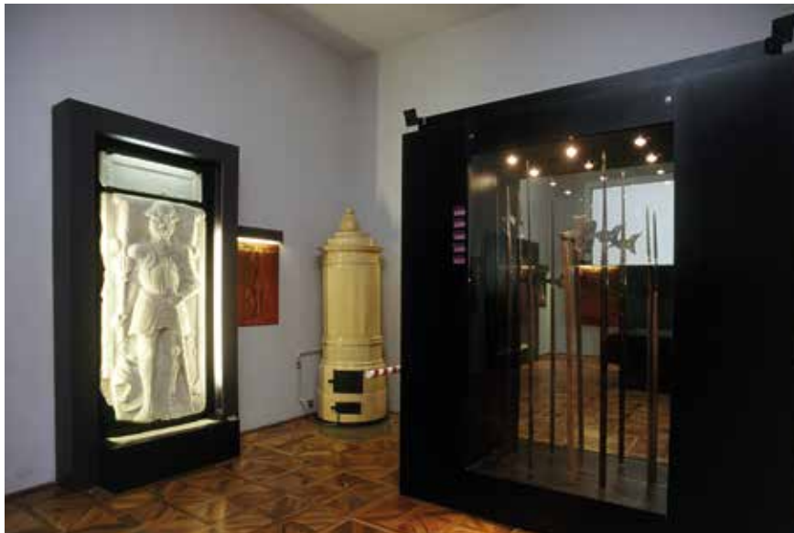
Dio izložbenog postava Muzeja seljačkih buna; MHZ

Muzej čuva i prikuplja građu vezanu za seljačke bune, život plemića i seljaka te predmete iz kulturnog, povijesnog i umjetničkog naslijeđa Hrvatskoga zagorja. Muzejska građa svrstana je u nekoliko zbirki: kulturno-povijesna, likovna, etnografska, arheološka, zbirka zagorskog suvenira, zbirka razglednica i fotografija, zbirka oružja i vojne opreme i zbirka Viktorije Oršić. U muzeju su pohranjeni arheološki nalazi sa srednjovjekovnoga feudalnoga grada Konjščine. Godine 1992. utemeljena je ustanova Muzeji Hrvatskoga zagorja, pa Muzej seljačkih buna postaje njezin sastavni dio. Podno brijega Samci na kojem se nalazi dvorac podignut je spomenik Seljačkoj