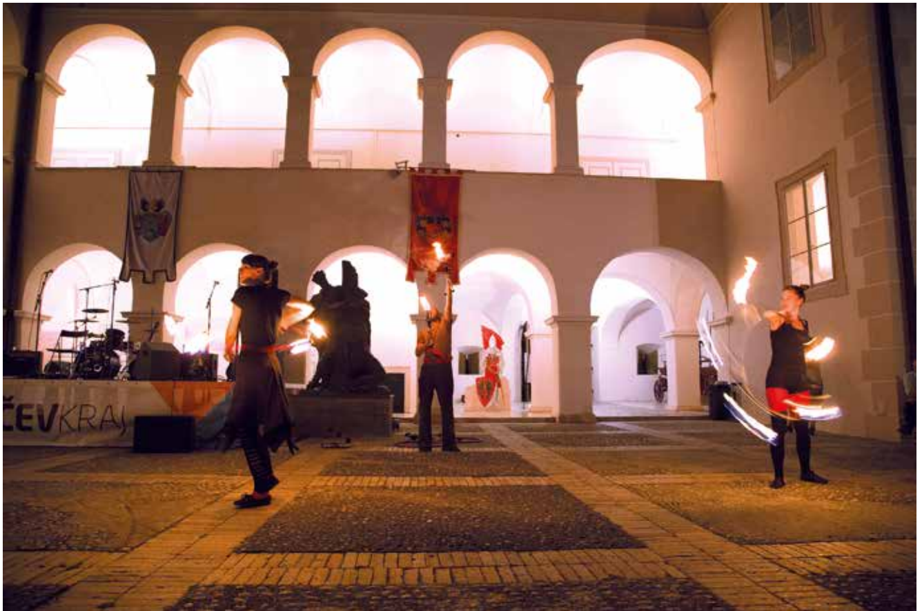
Ljeto u dvorcu Oršić; MHZ

buni i Matiji Gupcu. Autor spomenika je kipar Antun Augustinčić (1900.-1979.), rodnom iz Klanjca, gdje se nalazi galerija koja nosi njegovo ime i gdje su izložena njegova djela. Kameni spomenik s velikim brončanim reljefom dug je 40 metara. U sredini je figura Matije Gupca s raširenim rukama, visoka 6,5 metra, a pokraj nje je figura Petrice Kerempuha s tamburom, u prirodnoj veličini. Reljef prikazuje više od tri stotine likova uklopljenih na jednoj strani u prizore Stubičke bitke (ljudi, konji, sudar plemićke vojske i seljaka), a na drugoj strani u prizore svakodnevnog života u 16. stoljeću.