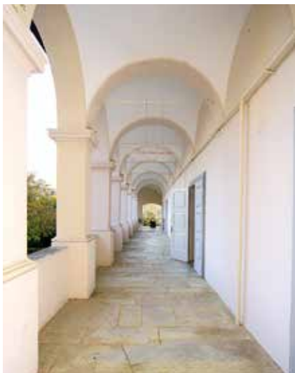
Zapadni arkadni hodnik na dvorišnoj strani dvorca