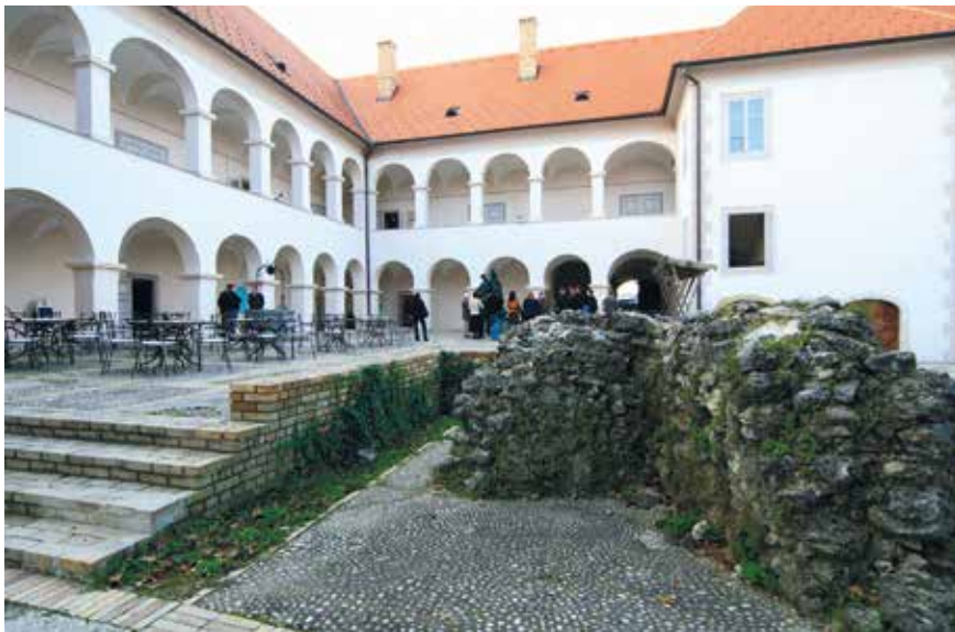
Južno dvorišno pročelje