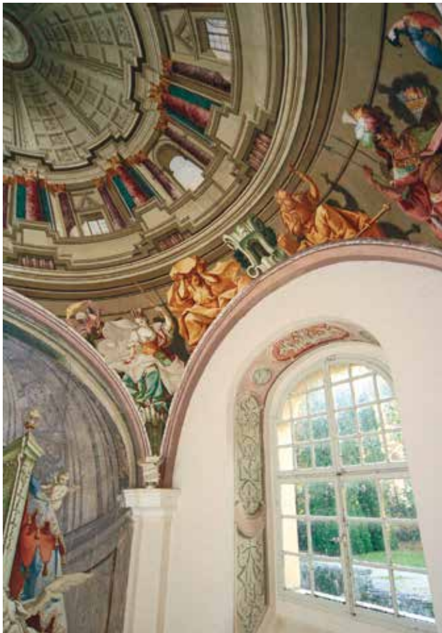
Oslik dvorske kapele; zbirka Šćitaroci