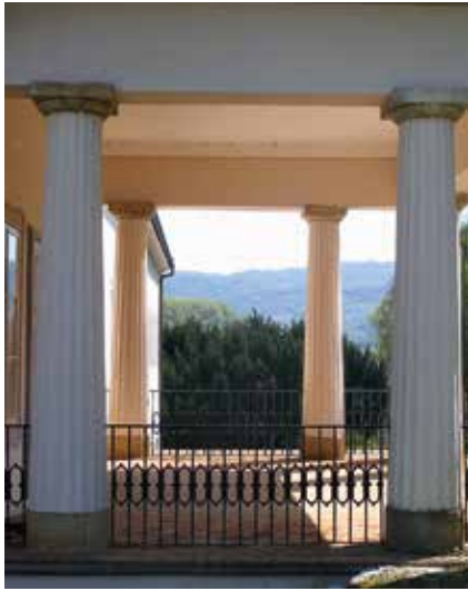
Klasicistički trijem; zbirka Šćitaroci

gom brežuljku je crkveno središte sa srednjovjekovnom barokiziranim crkvom sv. Jurja, u čijem se podnožju razvilo naselje. Pokraj crkve je Gupčeva lipa, zaštićeni spomenik prirode kulturno-povijesnog značaja. Ta dva brežuljka – jedan s dvorcem, drugi s crkvom – povezana su šetnicom i alejom lipa, podignutima 1973. godine.