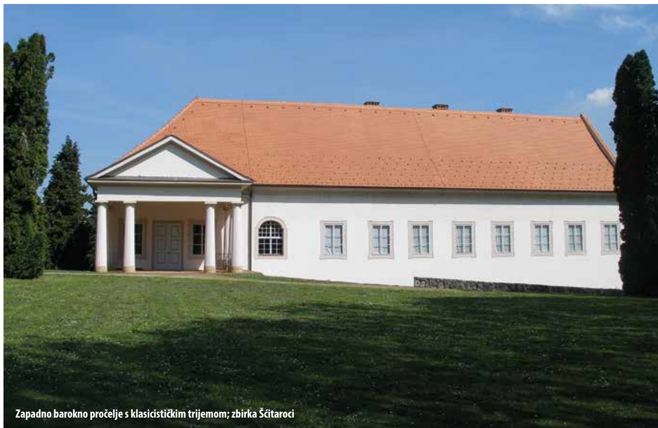
Zapadno barokno pročelje s klasicističkim trijemom

U srednjem vijeku bio je feudalni/plemički grad (burg) koji se prvi put dokumentirano spominje u 13. stoljeću