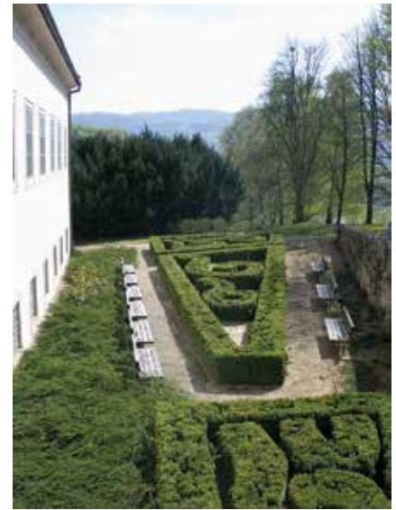
Uresni vrt uza zapadno krilo dvorca