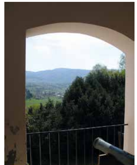
Završetak arkadnog hodnika s pogledom na Medvednicu; zbirka Šćitaroci