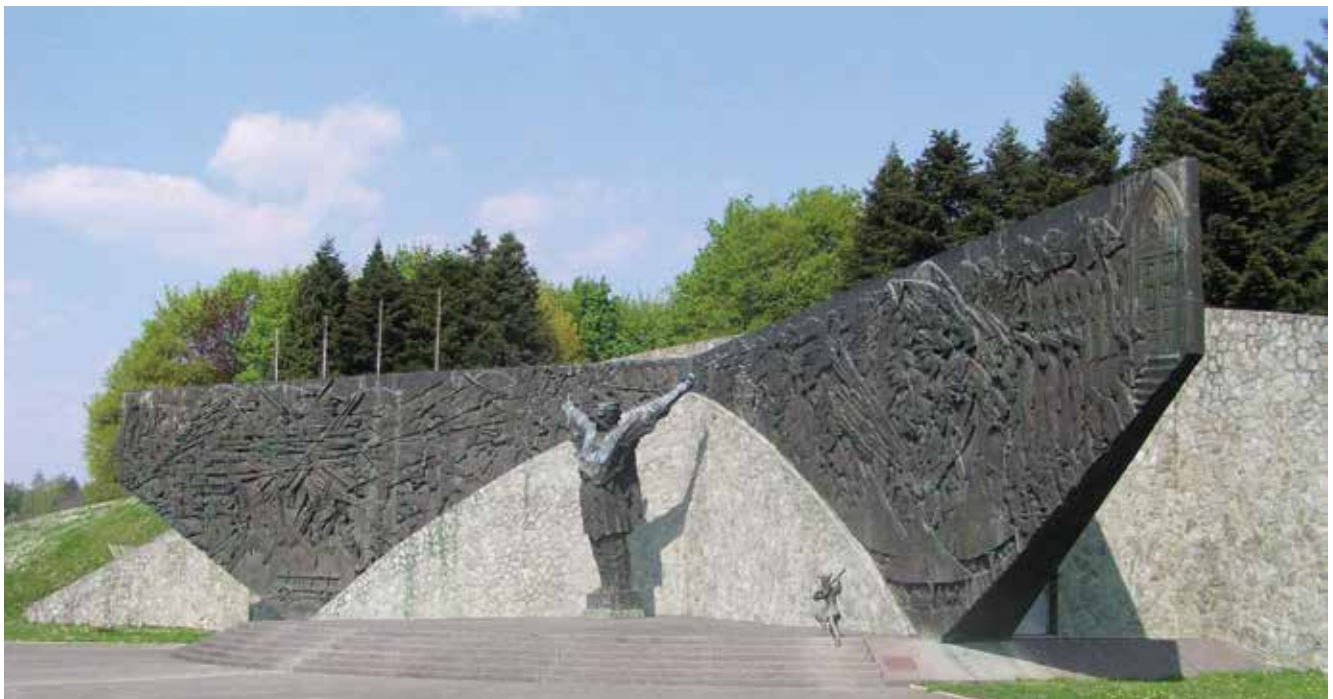
Spomenik Seljačkoj buni i Matiji Gupcu, autor Antun Augustinčić

vinograd, a većim dijelom u prirodnu šumu hrasta kitnjaka i običnoga graba s unesenim crnogoričnim vrstama drveća. Teško je zamisliti da dvorac izgrađen sredinom 18. stoljeća nije imao perivoj ili da ni jedno staro stablo nije sačuvano ako je perivoj postojao. Moguće je obrazloženje da perivoj nije bio ni potreban zbog atrak-