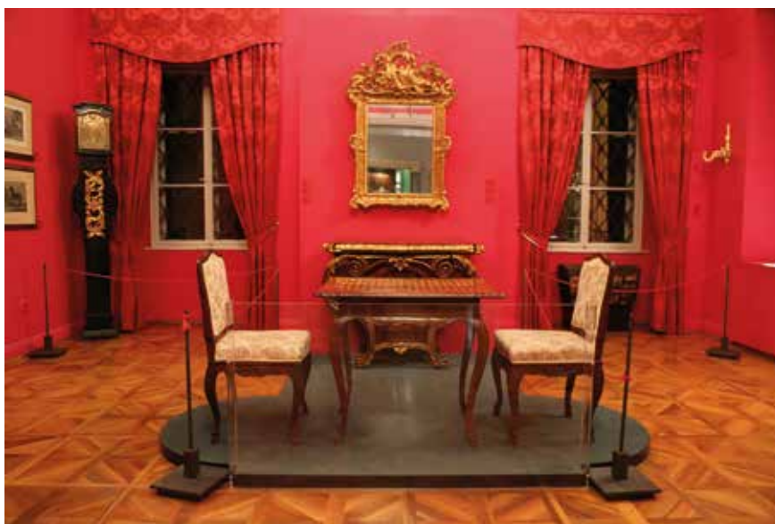
Dio izložbenog postava Muzeja seljačkih buna; MHZ