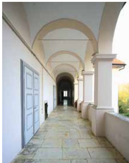
Sjeverni arkadni hodnik na dvorišnoj strani dvorca; zbirka Šćitaroci