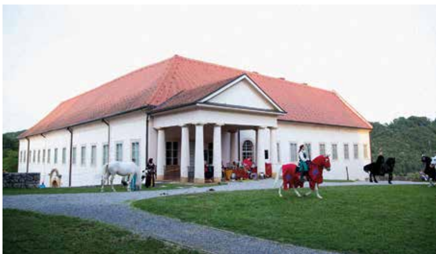
Viteški turnir u dvorcu Oršić; MHZ